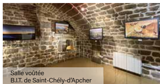
Salle voûtée B.I.T. de Saint-Chély-d'Apcher