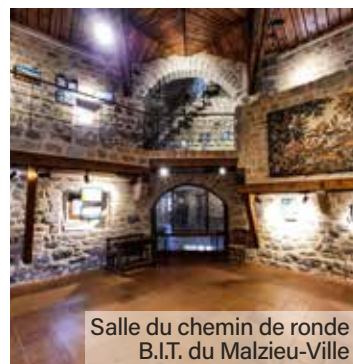
Salle du chemin de ronde B.I.T. du Malzieu-Ville