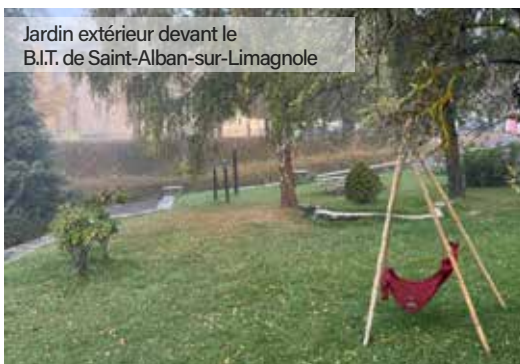
Jardin extérieur devant le B.I.T. de Saint-Alban-sur-Limagnole